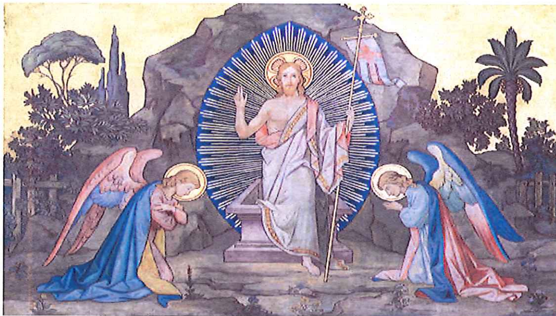
Fresk Zmartwychwstania w kościele Kostel Svatcho Cyrila Metodeje, Praga

„ Śmierć zawarła się z życiem i w boju, o dziwy, choć poległ Wódz życia, króluje dziś żywy” (Sekwencja na Dzień Zmartwychwstania)